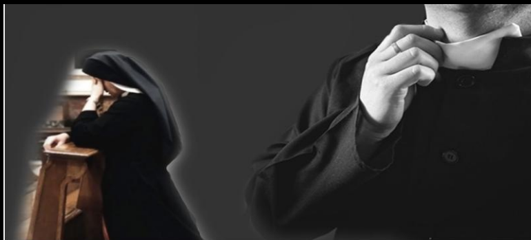
Ilustrasi "Mantan" Biarawati korban aksi kejahatan seksual oleh seorang pastor (Katolikana/Willy Sucipto).

NASIONAL Laporan Khusus: Nyanyi Sunyi "Mantan" Biarawati Korban Aksi Kekerasan Seksual di Jantung Gereja