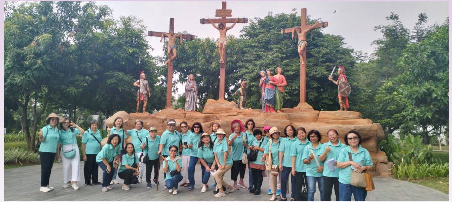
Barisan hijau tosca muda berpose di Taman Doa Kasih Mulia Sejati.