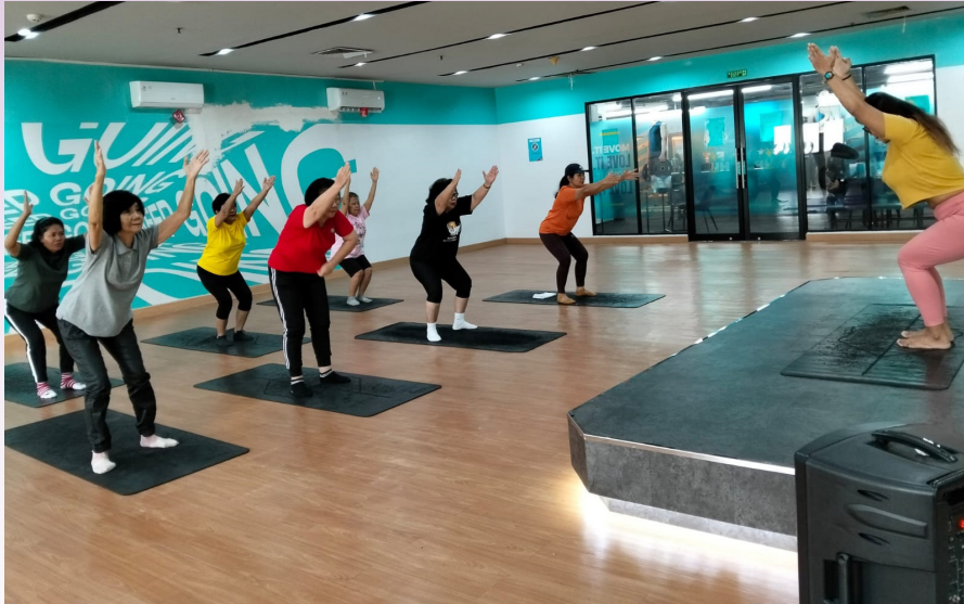
Tangan di atas, badan sedikit ditekuk... semangat sehat!!!