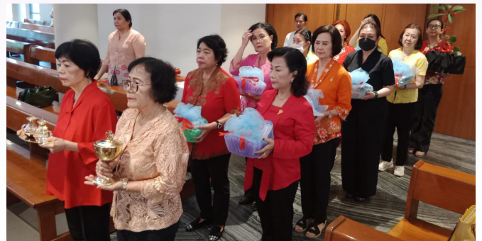
Pembawa persembahan dari Bidang Kesejahteraan Ranting dan Cabang.