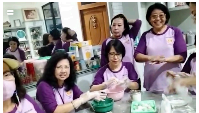
Adonan ketan dibulatkan, diisi kacang... jadi deh wedang ronde hangat.

Ada yang membulatkan adonan ketan berisi kacang, ada pula yang meracik kuah jahe aromatik. Dapur riuh oleh tawa dan wangi rempah. Tak butuh waktu lama, semangkuk wedang ronde hangat tersaji. Pagi yang basah pun berakhir manis, membuktikan bahwa kebersamaan jauh lebih hangat daripada cuaca di luar. (Cicilia Susanti)