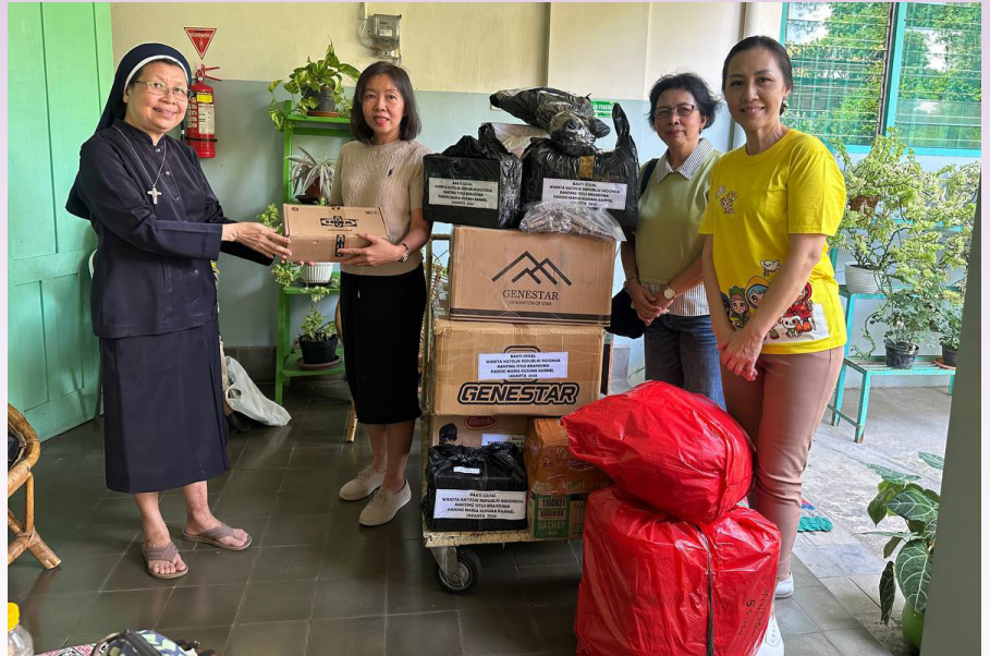
Aksi sosial ke Panti Asuhan Santa Maria Ganjuran.

Ziarah dilanjutkan ke Gereja Santa Maria Assumpta, Pakem yang menghadirkan suasana doa yang khusyuk. Selanjutnya, rombongan mengunjungi Gereja dan Candi Hati Kudus Yesus di Ganjuran, yang sarat dengan nilai inkulturasi iman dan budaya.