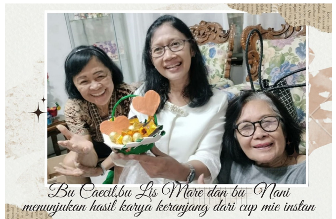
Bu Caecil, bu Lis Mare dan bu Nani menunjukkan hasil karya keranjang dari cup mie instan

Banyak Ibu-Ibu yang kesulitan menganyam, tapi