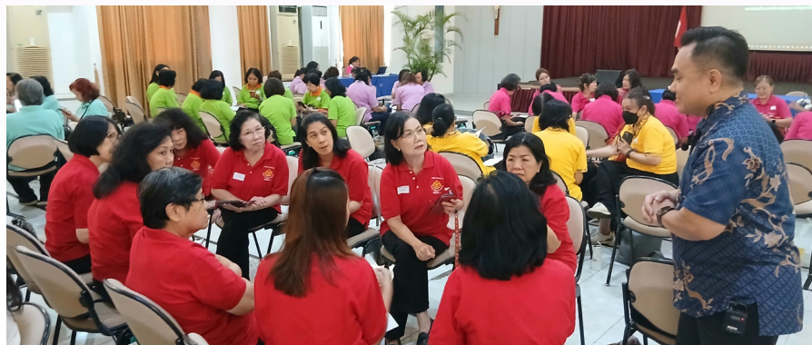
Sesi diskusi kelompok.