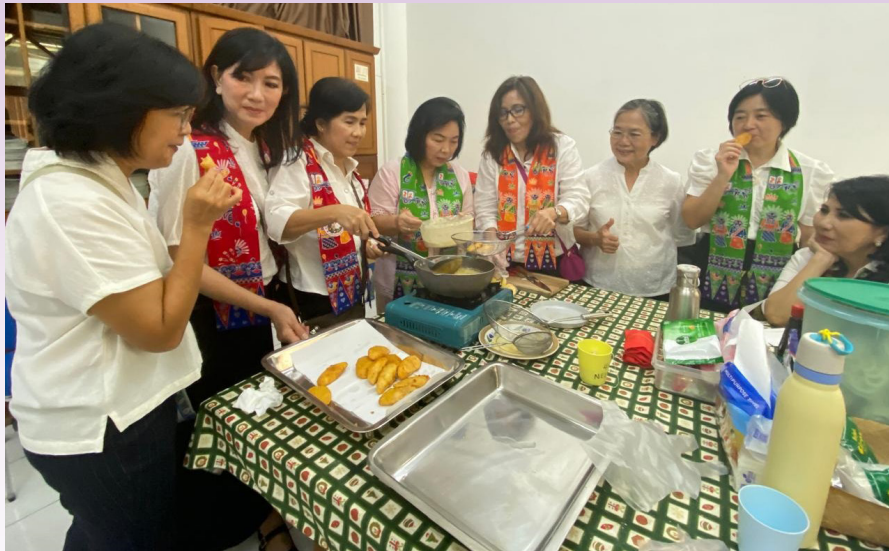
Pisang goreng yang menghangatkan suasana.